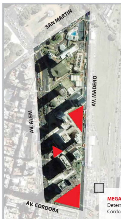
MEGA MANZANA Determinada por las Avenidas Além, Córdoba, Madero y la Calle San Martín.

Envíanos tus ideas a través de Facebook grupo "red por Buenos Aires", a través del correo info@redporbuenosaires.com.ar o en nuestra Web www.redporbuenosaires.com.ar